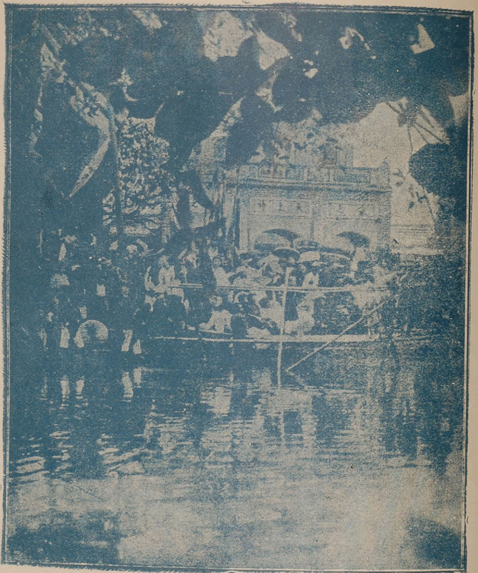
Hội đèn Gióng